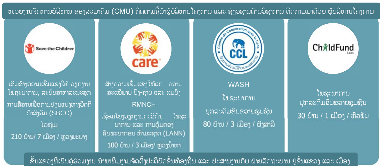
ຮູບ: ຄວາມຮູ້ຄວາມສາມາດຂອງຄູ່ຮ່ວມງານ ແລະ ຖານປະຕິບັດການ ໃນໂຄງການ SCALING